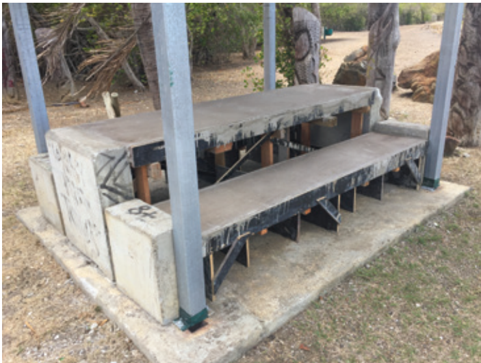
Reprise des tables au camping de tomo suite aux dégradations du début d'année