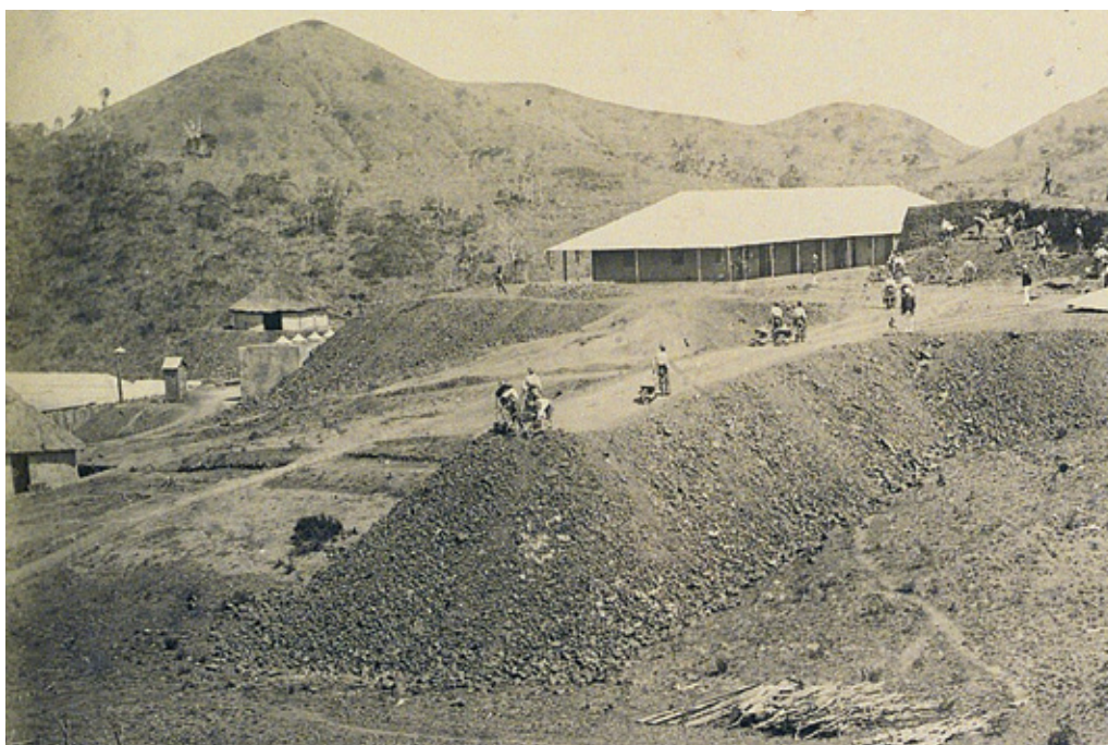
3/ Le tristement célèbre camp Brun, circa 1890

Ce camp avait été ouvert pour « accueillir » les incorrigibles du bagne calédonien. De nombreuses anecdotes évoquent ce lieu funeste.