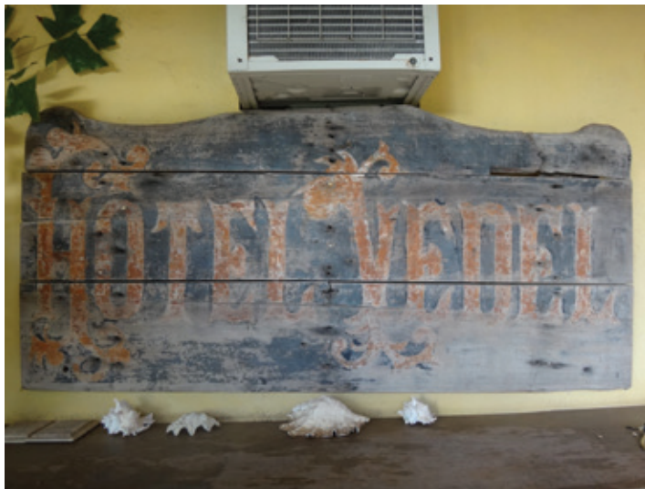
1/ L'enseigne de l'hôtel VEDEL, fermé dans les années 1950.

Toutes les personnes souhaitant apporter des témoignages, des généalogies, des récits de vie, des photographies et des gravures, des documents familiaux, des objets historiques ou autres, sont invitées à contacter l'historien Frédéric Angleviel au 25 15 98 ou 99 88 19 ou la mairie au 35 17 06.