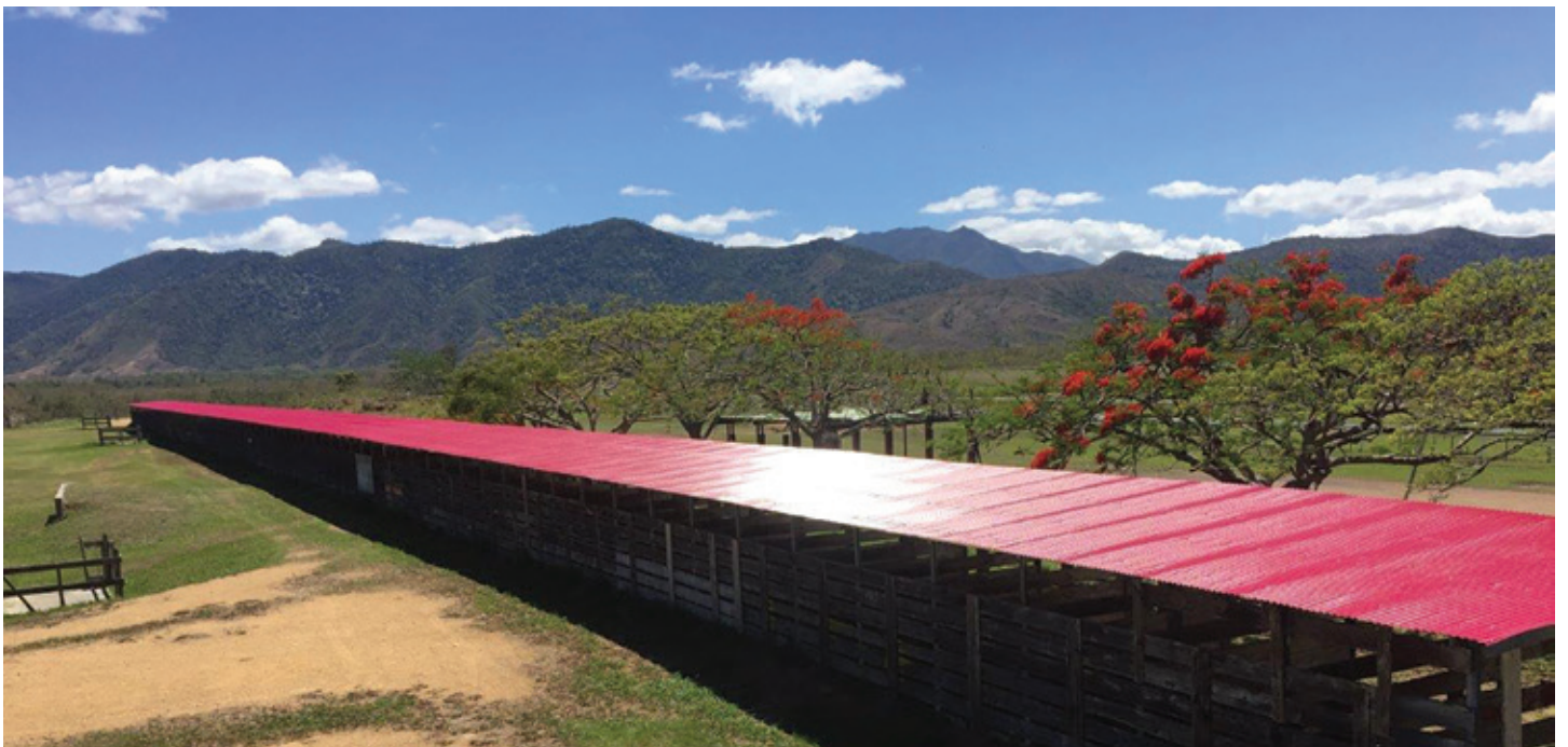
Remise à neuf de la toiture des écuries à l'hippodrome soit un peu plus de 600 m 2