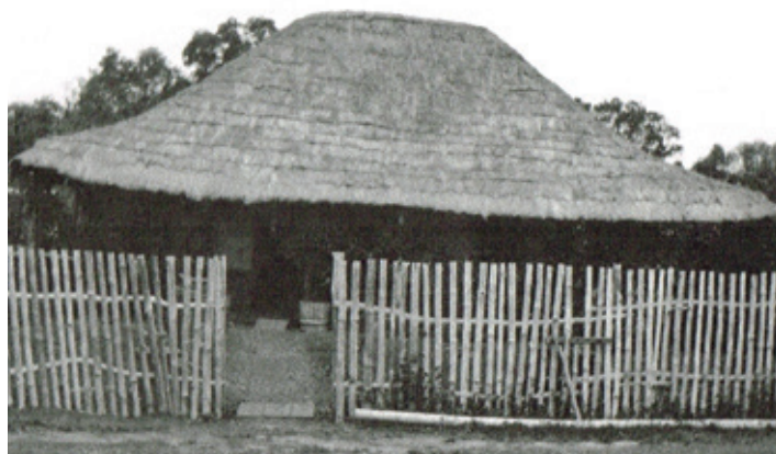
2/ La première maison Mathieu à Gilliès vers 1920.

Toute photo sur les premières habitations de la commune sont recherchées. De même les installations agricoles, les ponts, les routes, les paysages, les hommes et les femmes, les pique-niques ou tout autres événements de la vie des Boulouparisiens !