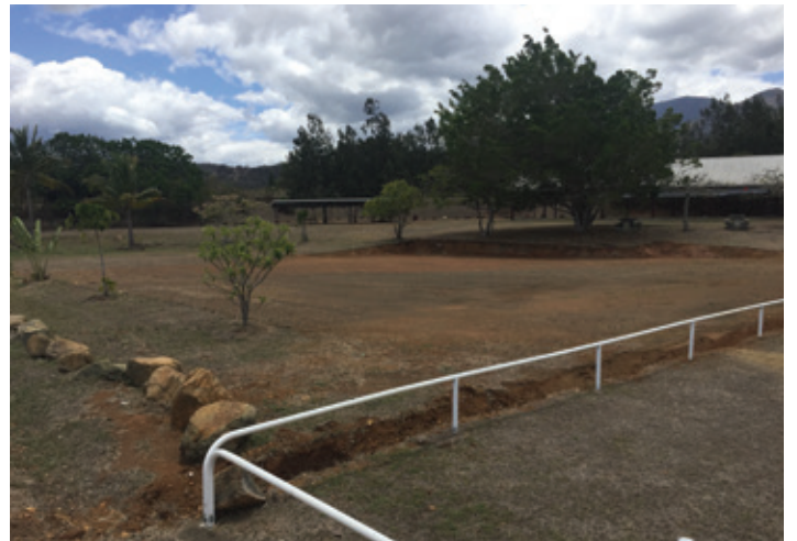
Terrassement des futurs boulodromes au marché de Tomo