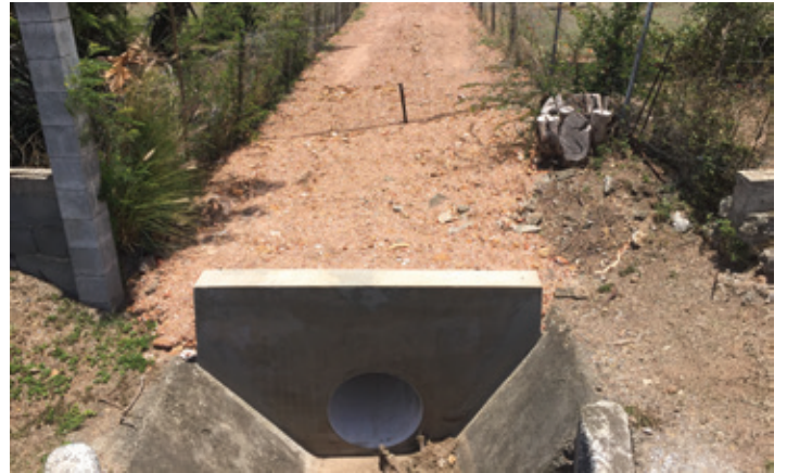
Reprise d'une servitude d'assainissement pour faciliter l'entretien mais surtout stopper l'érosion de l'ancien caniveau à ciel ouvert à Port Ouenghi