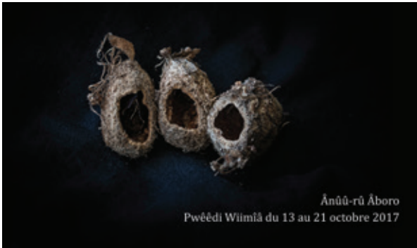
Ânûû-rû Âboro Pwèédi Wiimlâ du 13 au 21 octobre 2017

À cette occasion, il y a eu trois séances proposées les vendredi 13, mardi 17 et jeudi 19 octobre, la dernière ayant été perturbée par la coupure d'électricité générale.