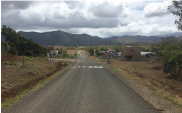
Réalisation de dos d'ânes pour la sécurité des enfants au lotissement de Tchiné