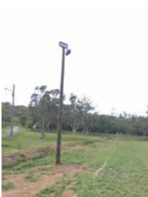
Mise en place d'un éclairage public au terrain de foot de Ouitchambo