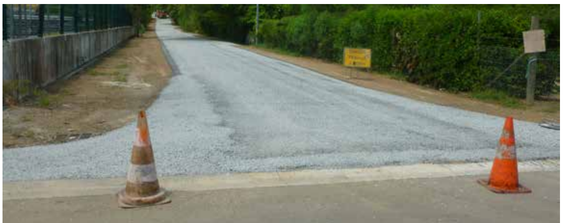
Réfection de la chaussée (rue derrière SOPROTEC)