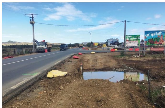
La DITTT procède actuellement à l'amélioration du carrefour de la route de Thio. Plusieurs îlots centraux prendront place pour réguler le trafic et notamment la vitesse des usagers. Dans ce même objectif, la limite de l'agglomération sera déplacée plus au nord.