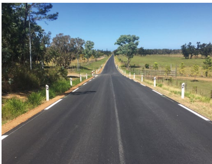
La RM7 est actuellement en pleine refecton : élargissement de la chaussée et reprise du revêtement sont en cours.