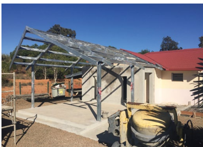
La morgue municipale, initialement constituée d'une chambre funéraire et d'un petit auvent pour abriter les familles venues se recueillir est devenue insuffisante. Il a été décidé la création d'un grand auvent d'une soixantaine de mètres carrés muni d'un sas d'entrée. Ces travaux d'agrandissement seront l'occasion de réaliser une rénovation générale et une amélioration de l'aménagement paysager.