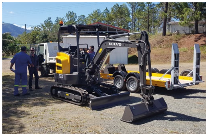
Une mini pelle flambant neuve a été livrée aux ateliers municipaux. Cet outil permettra notamment de curer des caniveaux.