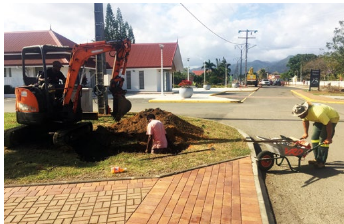
L'enfouissement des réseaux se poursuit : avant la fin de l'année, l'ancienne ligne haute tension aura disparu.