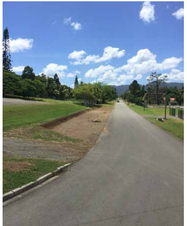
Travaux pour la zone de stockage des bus à l'école Daniel Mathieu.