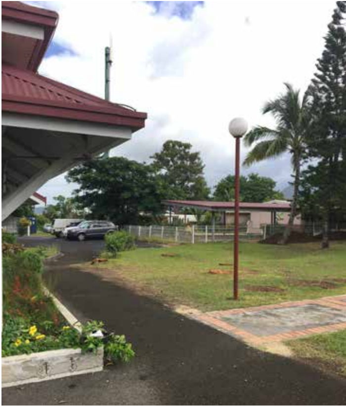
Abatage des végétaux en vue des travaux de rénovation et d'extension de la mairie.