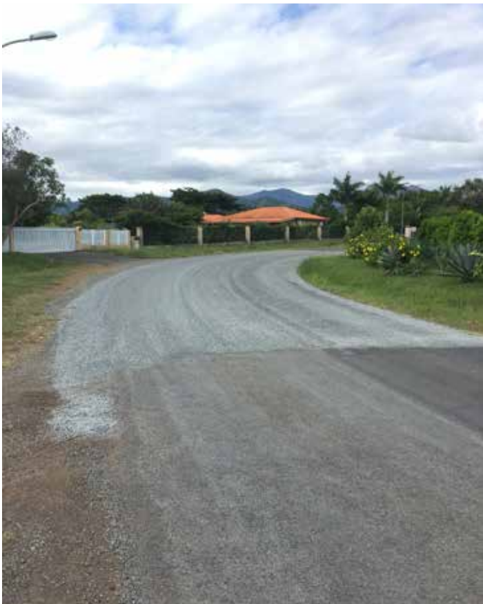
Reprise de chaussée sur l'Avenue de Port Ouenghi.