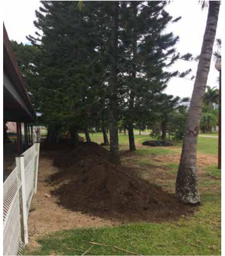
Aménagement paysager du parc près de la mairie.