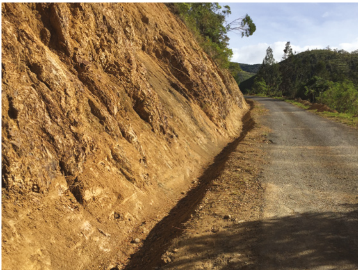
Curage caniveau Kouergoa sur 1800 mètres

Les nouvelles installations de la mairie mise en service par la Calédonienne des Eaux :