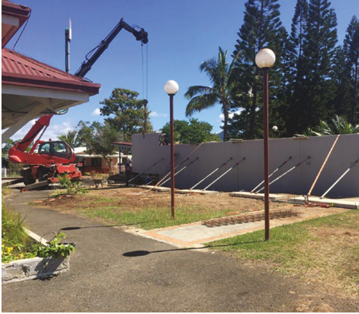
Chantier d'extension de la mairie