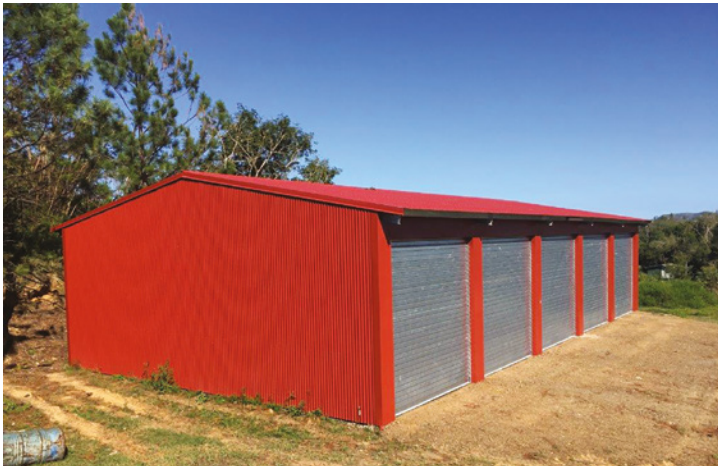
Construction d'un nouveau dock municipal