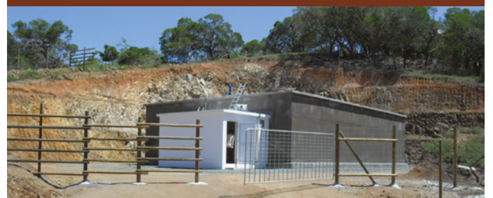
Les nouvelles installations de la mairie pour la Calédonienne des Eaux.

Le nouveau réservoir en béton armé de 600 m 3 à la Ouenghi.