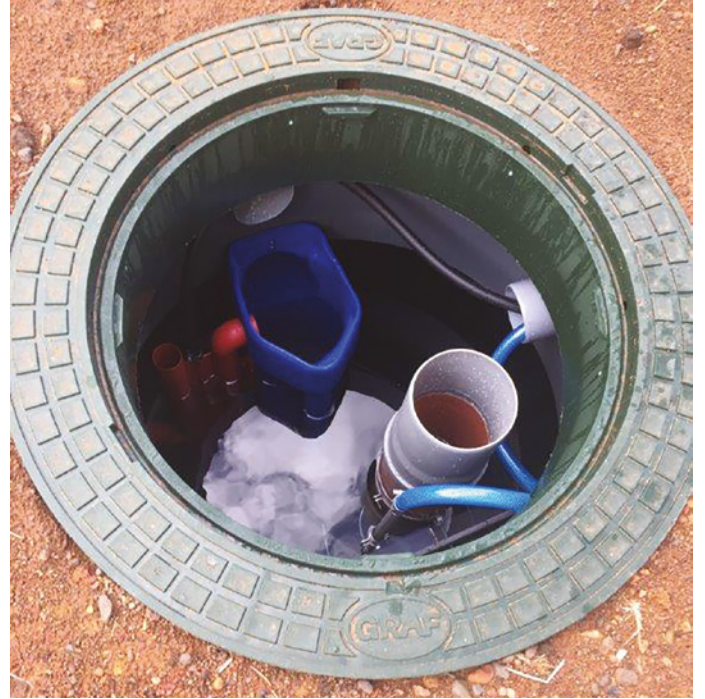
Installation d'une mini station d'épuration à l'école Daniel Mathieu